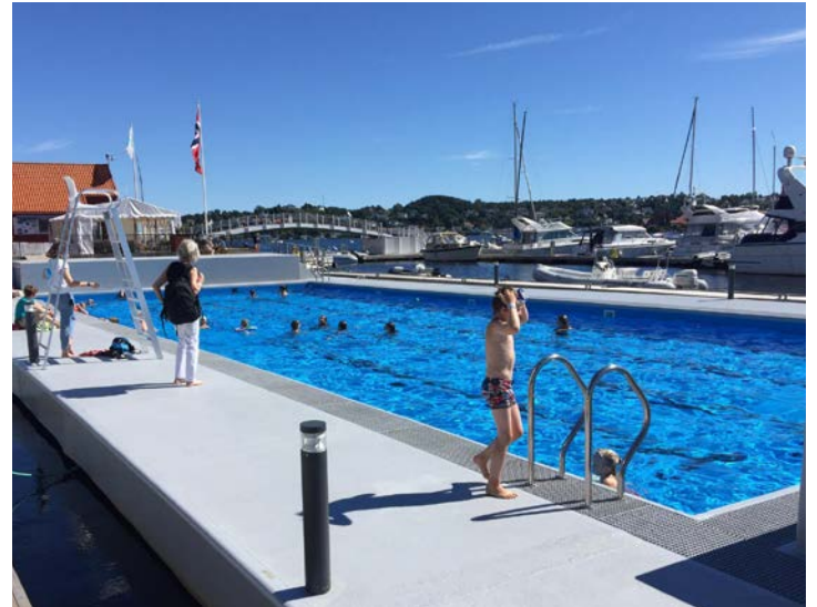
I DEN STORE GJESTEHAVNA med ca. 300 plasser har havnevesenet gått litt lenger for å trekke båtturister, og få de til å bli lenger. Et stort varmtvannsbasseng er blant tilbudene.