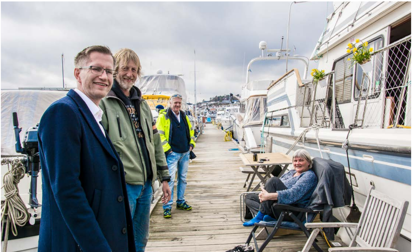
ORDFØREREN HAR SEILT i mange år, og reist langt om sommeren. Da er det ekstra hyggelig å ta en prat med båtfolket i gjestehavna – selv tidlig på våren.

sentrum – «pollen» for primært dagsturister og den store, moderne havna en spasertur unna.